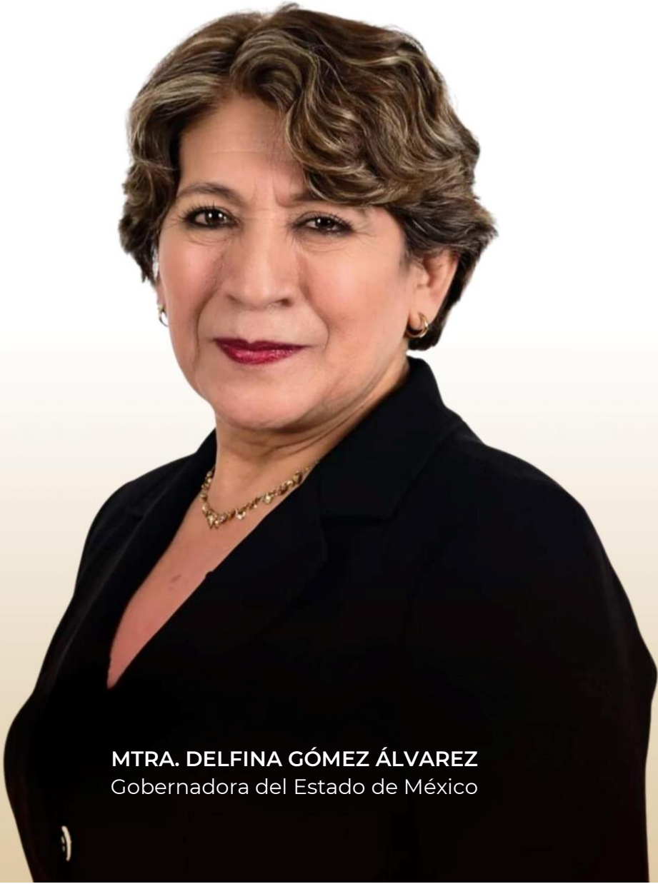
MTRA. DELFINA GÓMEZ ÁLVAREZ Gobernadora del Estado de México