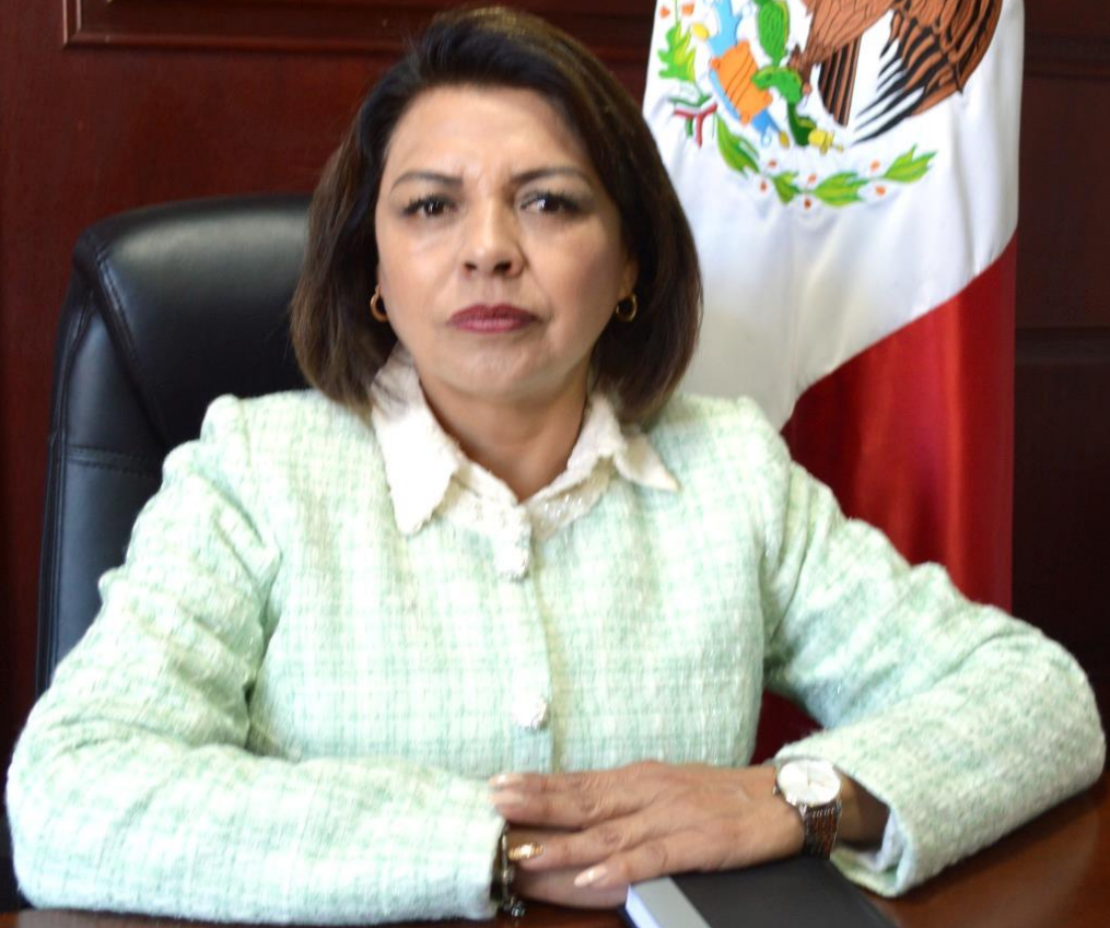
MTRA. ROSA ELVA BARRERA FLORES Presidenta Municipal Constitucional de Hueypoxtla