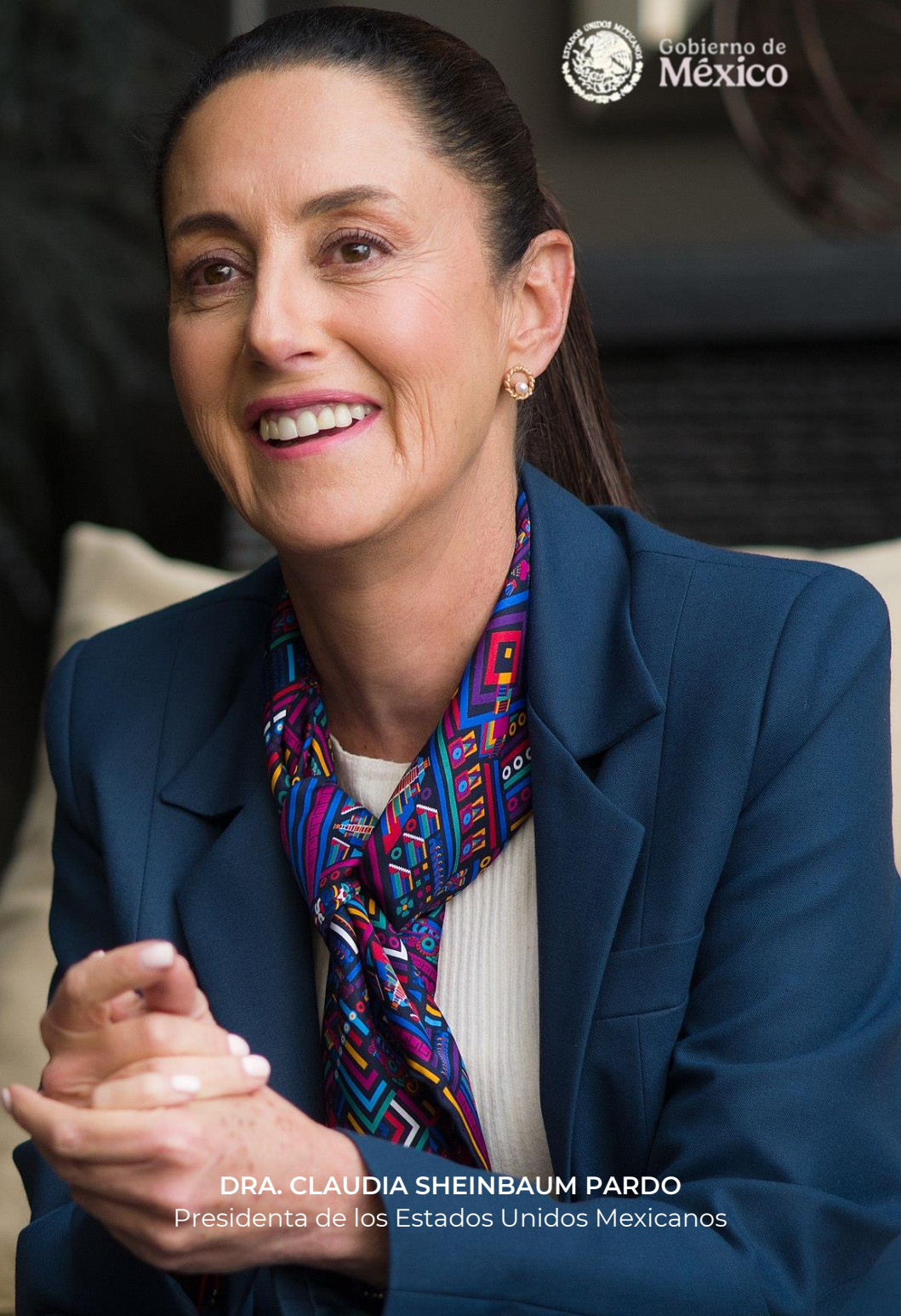
DRA. CLAUDIA SHEINBAUM PARDO Presidenta de los Estados Unidos Mexicanos